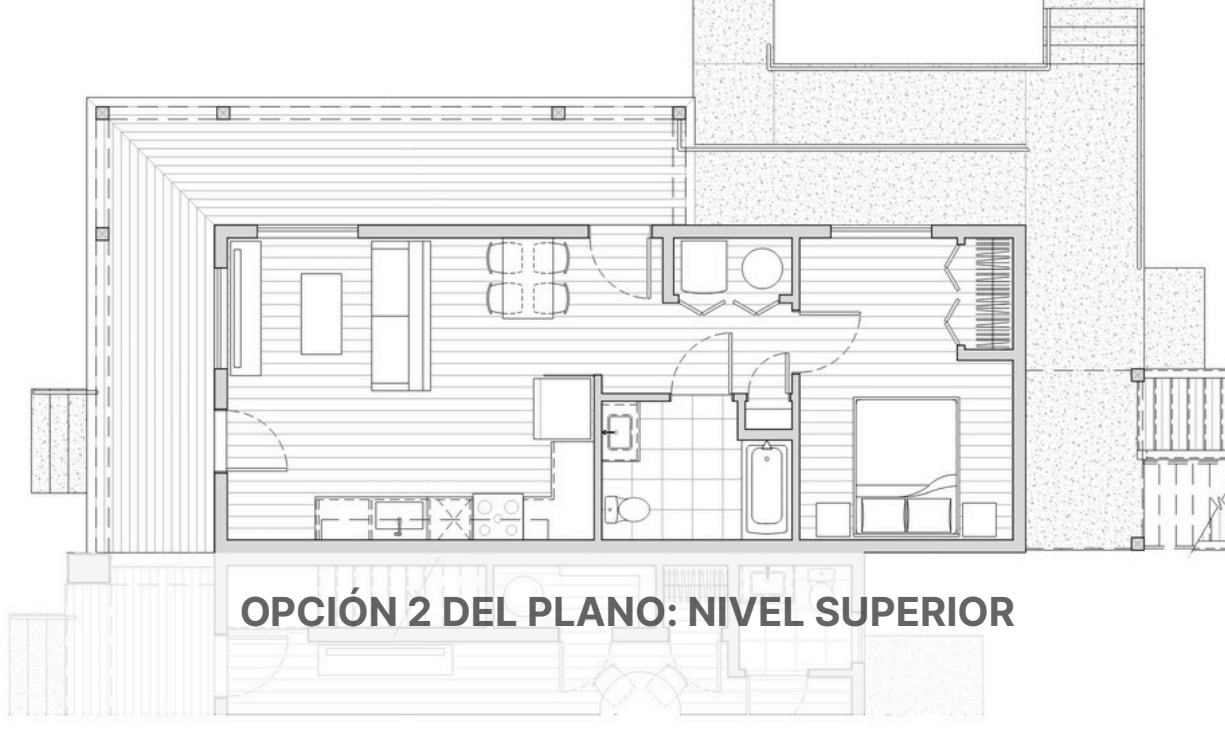
OPCIÓN 2 DEL PLANO: NIVEL SUPERIOR