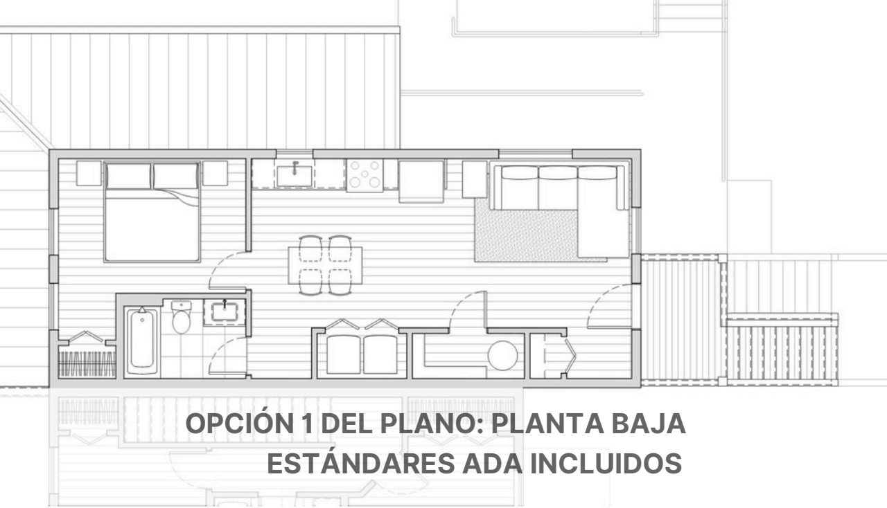
OPCIÓN 1 DEL PLANO: PLANTA BAJA ESTÁNDARES ADA INCLUIDOS